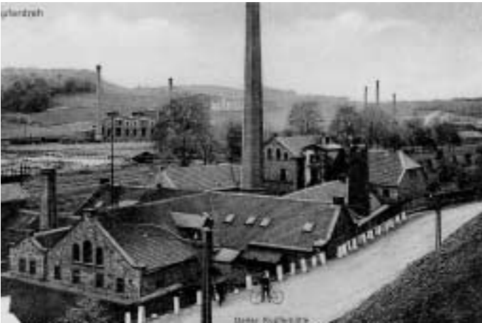
Kupferhammer, um 1920

bachtal kann vor allem von Kindern im »historischen Spiel« und der »Forscherwerkstatt Deilbachtal« erlebt werden.