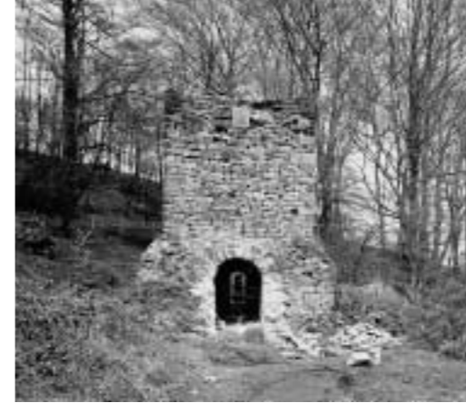
Schornsteinstumpf des Kesselhauses der Zeche Victoria, um 1980

Der 1994 gegründete Verein IDEE – Initiative Denkmäler Essens erhalten – e. V. koordinierte im Rahmen des »Essener Konsenses« die Instandsetzung des Halbachhammers. Auf der Grundlage dieser Erfahrungen widmet sich der Verein heute der Erhaltung der Kulturdenkmäler der Museumslandschaft Deilbachtal. Diese wird eine Zukunft haben, wenn es erneut gelingt, eine Koalition verschiedener Förderer zusammenzuführen.