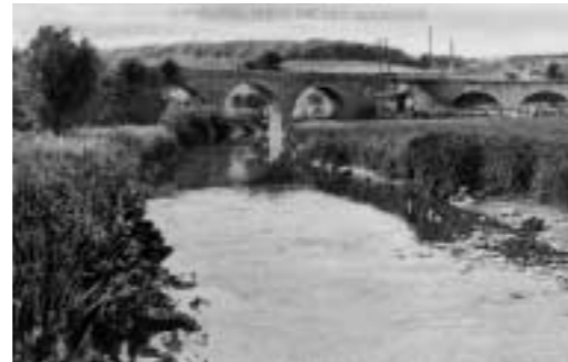
Huntebrücke, Postkarte, o. A. Ruhrlandmuseum

Holzkohle, die für die Metallschmelze und -bearbeitung benötigt wurde. Das Wasser des Deilbaches diente dem Antrieb von Hämmern und Mühlen. Die verkehrsgünstige Lage des Tales, seine Anbindung an den Rhein durch die Schiffbarmachung der Ruhr ab 1770 und die Verbindung zu dem frühindustrialisierten Wuppertaler Raum durch den Bau der Prinz-Wilhelm-Bahn 1830/31 erweiterten die Absatzmöglichkeiten der gewerblichen Betriebe.