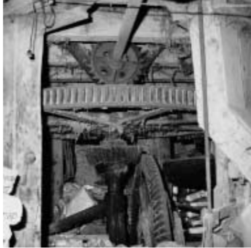
Deiler Mühle, Blick in das Mahlwerk, um 1980

Gebäude und maschinelles Inventar sind in ihrer Substanz gefährdet und bedürfen dringend einer Sanierung. Als letzte an ihrem originalen Standort erhaltene Zeugnisse einer historischen Produktionstechnik könnten sie – instandgesetzt – einen besonderen Akzent setzen. Zusammen mit der Zeche »Zollverein XII« wären damit die Vorläufer und der Höhepunkt der Industriegeschichte auf Essener Stadtgebiet dokumentiert.