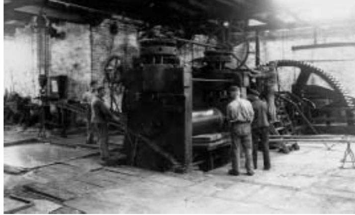
Walzwerk des Kupferhammers, 1930

Aufgrund der besonderen naturräumlichen Voraussetzungen entstand im Deilbachtal bereits im 16. Jahrhundert eine gewerbliche Wirtschaftsform. Die ausstreichenden Flöze in den Hanglagen ermöglichten schon früh den Abbau von Steinkohle. Erze, Sandsteine und Schieferferte waren die Grundstoffe für weitere Gewerbezweige. Ausgedehnte Wälder lieferten Holz zur Herstellung von