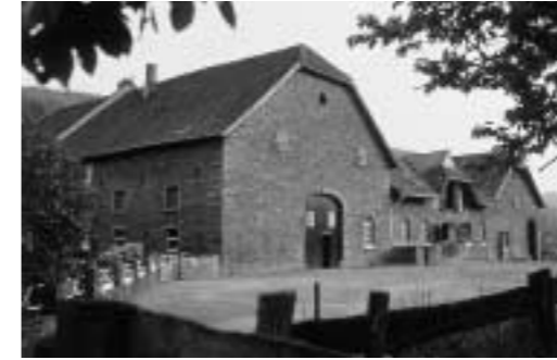
Deilmannscher Bauernhof, 1989

Gegenwart Die Kernobjekte der Museumslandschaft sind der erstmals im 13. Jahrhundert erwähnte Deilmannsche Bauernhof mit der Deiler Mühle und dem Deiler Eisenhammer, der um 1550 gegründete Kupferhammer, Reste einer Ringofenziegelei sowie verschiedene bauliche Hinterlassenschaften des Stein-