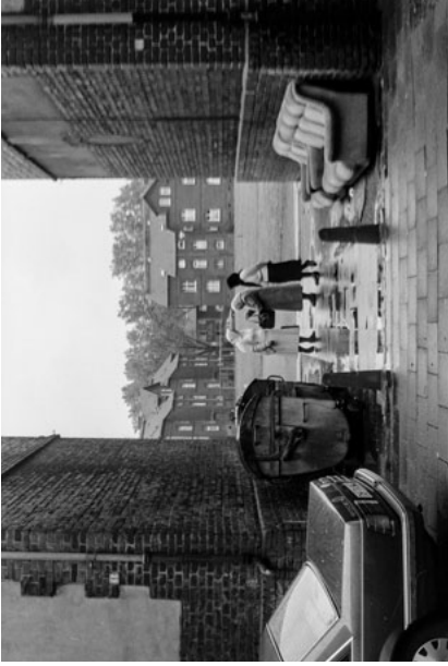
İşçi semtinde kadınlar, Sandstraße, Duisburg-Hamborn

Frauen in der Arbeitersiedlung, Sandstraße, Duisburg-Hamborn