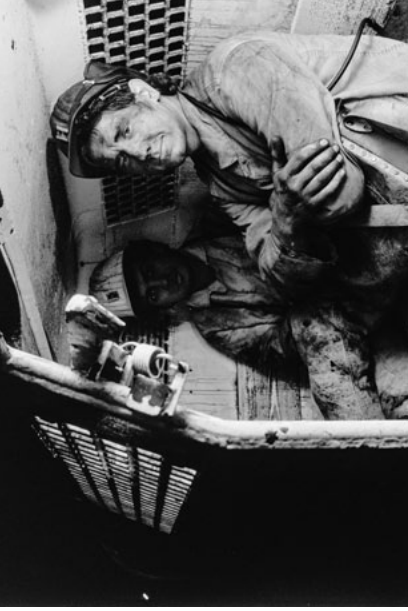
Zwei Bergleute im Personenwagen, Bergwerk Walsum, Duisburg